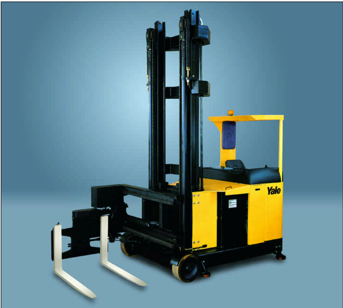
Der abgebildete Stapler enthält Sonderausstattungen.