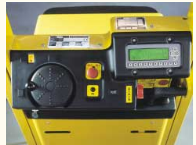
Die wichtigsten Steuerelemente sind leicht bedienbar in der Konsole untergebracht.