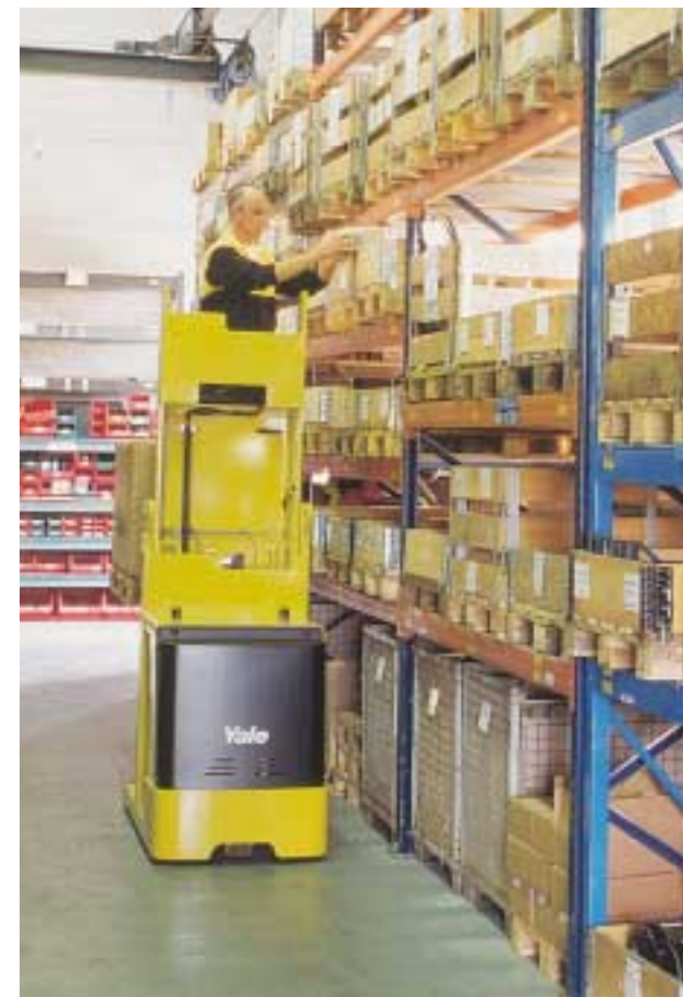
Höherer Bedienkomfort heißt mehr Produktivität.

Lieferbar mit einer Plattformhöhe von 1.200 mm, 1.700 mm und 3.200 mm. Der Zusatzhub gestattet es dem Bediener, Ladegut nach seinen individuellen Anforderungen auf einer konstanten Arbeitshöhe zu positionieren.