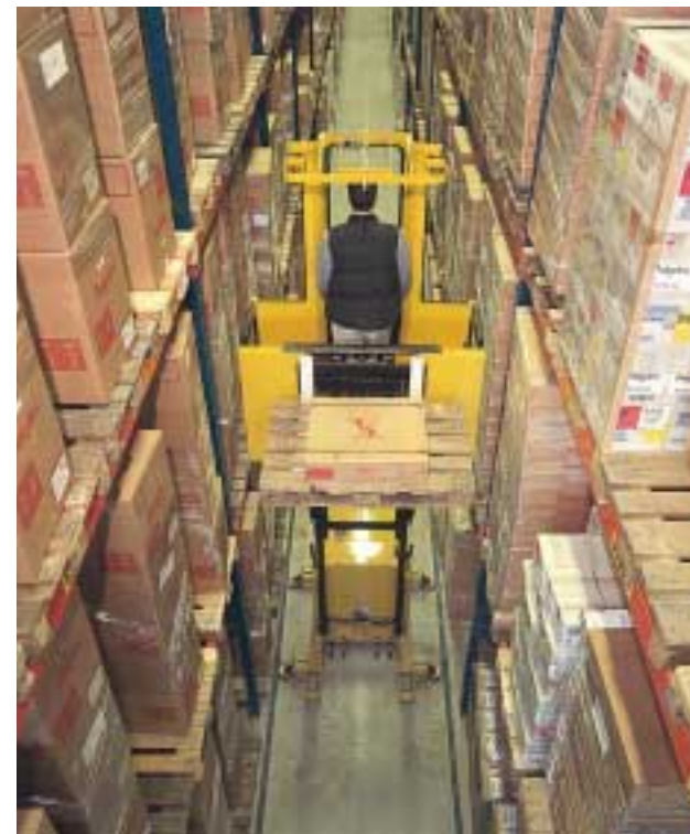
Die Versionen MO6 – MO10S verfügen über seitliche Führungsrollen. Dadurch können die Fahrzeuge in Gängen arbeiten, die kaum breiter als sie selbst mit Last sind.

Zur Erhöhung von Kommissionierleistungen und zur besseren Ausnutzung vorhandenen Raums lassen sich die Modelle MO6 bis MO10S mit Führungsrollen für die Schienenführung oder mit Induktivführungen ausstatten. Damit sind sie in Gängen einsetzbar, die nur um einige Millimeter breiter als das Kommissionierfahrzeug oder die Last selbst sind. Bei Zwangsführung kann der Bediener diagonal fahren und damit rasch den gewünschten Kommissionierplatz erreichen. Außerdem lässt sich auch in größeren Hubhöhen die maximale Fahrgeschwindigkeit beibehalten, was zu einer weiteren Produktivitätssteigerung führt. Alle Modelle können in breiteren Gängen frei betrieben werden.