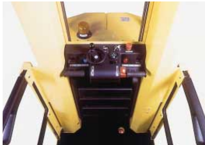
Die Steuerkonsole wurde bündig in die Kabine integriert, um den Durchgang möglichst groß zu halten.

Dank seiner 48-V-Anlage ist der MO10S ideal für intensive Einsätze und große Hubhöhen geeignet. (Die Modelle MO6 und MO10 sind mit 24-V-Anlagen ausgestattet.)