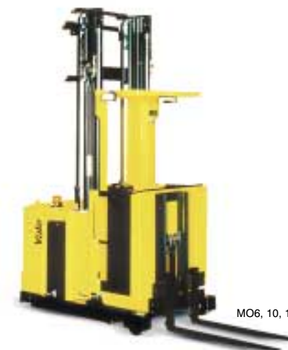
MO6, 10, 10S